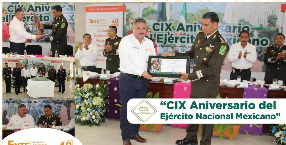
CIX ANIVERSARIO "CIX Aniversario del Ejército Nacional Mexicano"

Se llevó a cabo en el 20º Batallón de Infantería de la Secretaría de la Defensa Nacional (SEDENA), Berriozábal, Chiapas, el evento en donde se ratifican alianzas entre la Sección 40 del Sindicato Nacional de Trabajadores de la Educación (SNTE) conmemorando el CIX Aniversario del Ejército Nacional Mexicano, reconociendo a las fuerzas armadas de México en agradecimiento a su gran labor por el país, al igual que los maestros sirven a la educación del pueblo.