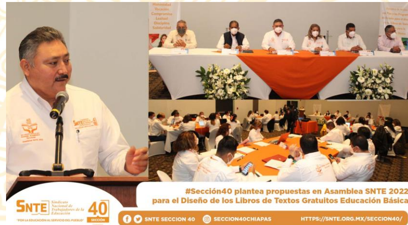
#Sección40 plantea propuestas en Asamblea SNTE 2022 para el Diseño de los Libros de Textos Gratuitos Educación Básica.

La Sección 40 del Sindicato Nacional de Trabajadores de la Educación (SNTE) analizó las propuestas de Educación Inicial, Prescolar, Primaria y Secundaria en mesas de trabajo, a través del Consejo Académico Seccional (CAS), enviadas por sus agremiados para defenderlas y proponerlas en la Asamblea Estatal de Análisis del Plan y los Programas de Estudio para el Diseño de los Libros de Texto Gratuitos para la Educación Básica 2022.